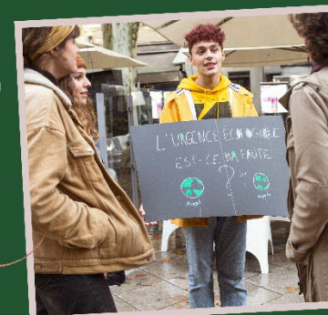
Porteur de paroles à Anglême

Notre pouvoir d'agir se vit dans le monde réel