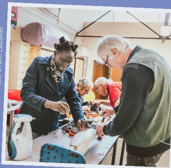
Repas café à Chemillé-en-Anjou, ©Yann Castanier