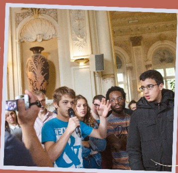
Réseau jeunes national